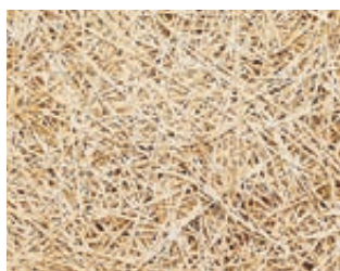
Ciment blanc (WZ)

Panneau acoustique en laine de bois 1 mm de large liée au ciment blanc ou gris